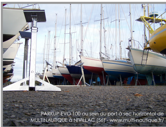
PARKUP EVO 100 au sein du port à sec horizontal de MULTINAUTIQUE à NIVILLAC (56) - www.multi-nautique.fr/

2010 : Prix départemental Stars & Métiers Banque Populaire