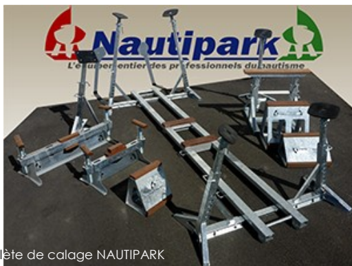
Gamme complète de calage NAUTIPARK

PARK UP Evo révolutionne le calage des bateaux.