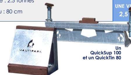
Un QuickSup 100 et un QuickTin 80

SORTIE D'EAU EN MOINS D'UNE MINUTE POUR UNE VEDETTE DE 2,5 TONNES