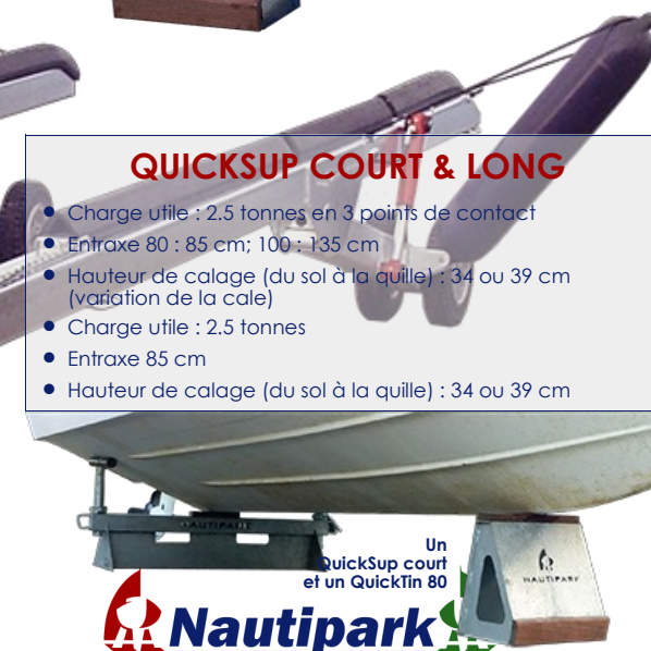
Un QuickSup court et un QuickTin 80

Nautipark L'équipementier des professionnels du nautisme