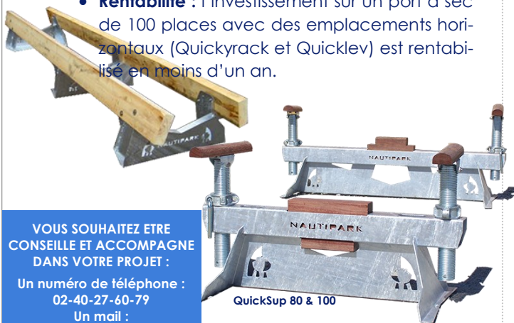
QuickSup 80 & 100

VOUS SOUHAITEZ ETRE CONSEILLE ET ACCOMPAGNE DANS VOTRE PROJET :