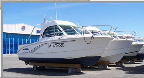
Stockage sur QUICKYRACK Photo prise sur le Port à Sec de ST PHILIBERT (56) www.nolimitmarine.fr