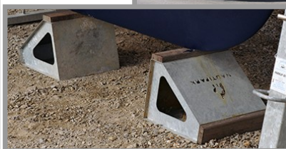
Complément de calage Photo prise sur le port à sec de LOIRE NAUTIC SERVICE (Cordemais - 44) www.port-a-sec.fr/