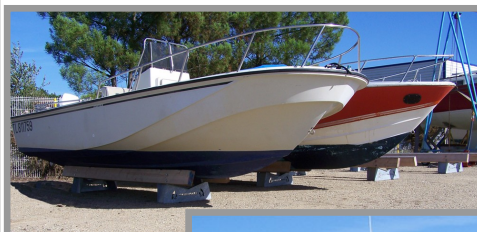
Stockage sur QUICKYRACK Photo prise sur le port à sec de PORT DE KERRAN (St Philibert) www.portdekerran.com